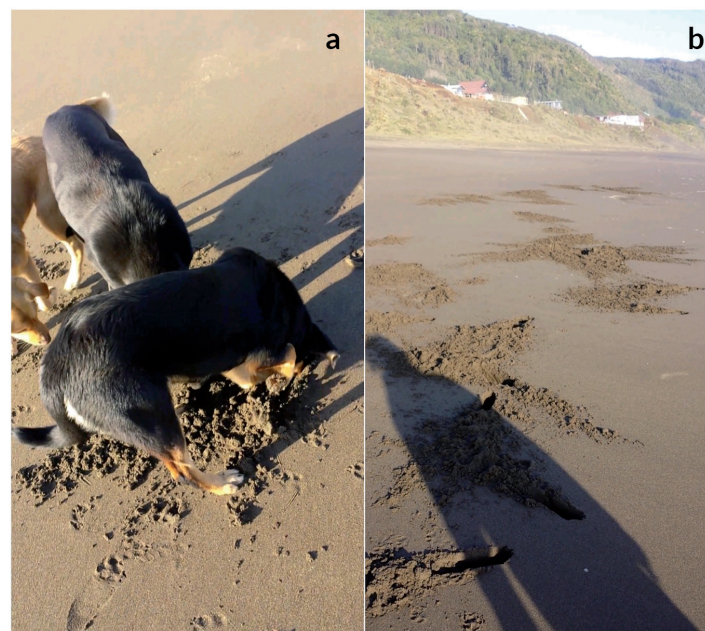
FIGURA 2. Actividades realizadas por los perros en Playa Curiñanco: (a) perros excavando en la arena en busca de Emerita analoga (b) Hoyos en la arena dejados por los perros en la playa. / Activities performed by dogs in Curiñanco beach: (a) dogs digging in the sand in search of Emerita analoga (b) holes in the sand made by dogs on the beach.